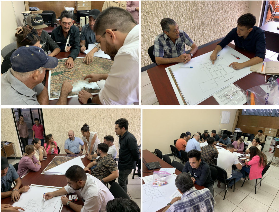
Figura 4. Cartografía social en Mezcala-Ojo de Agua- Tecomatlán.