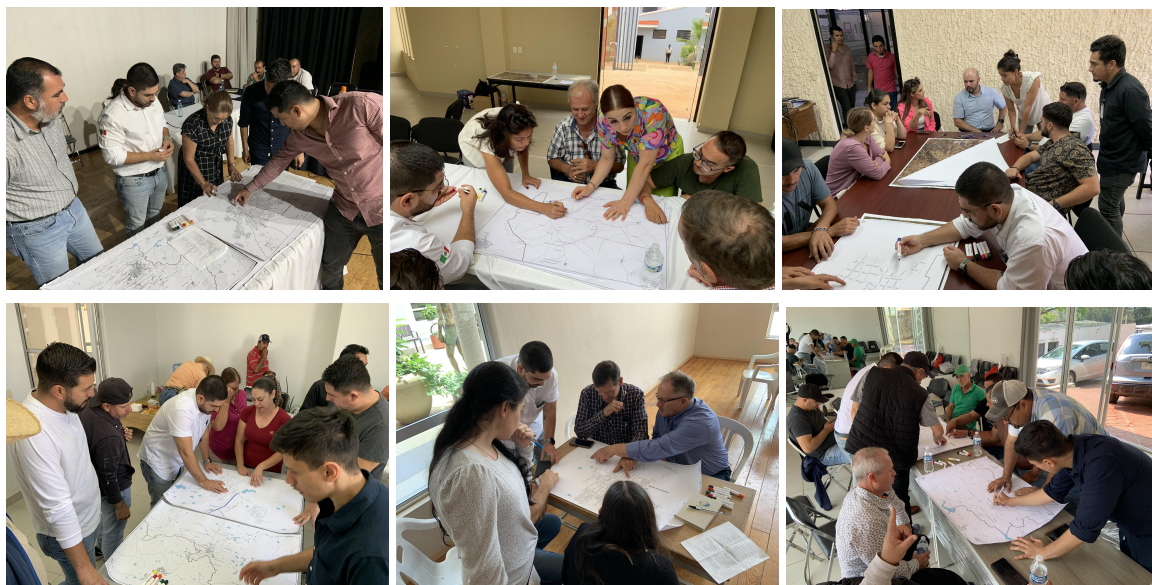
Figura 1. Focus Group

Para los focus group se siguió la misma metodología y orden del día, la cual se muestra a continuación: