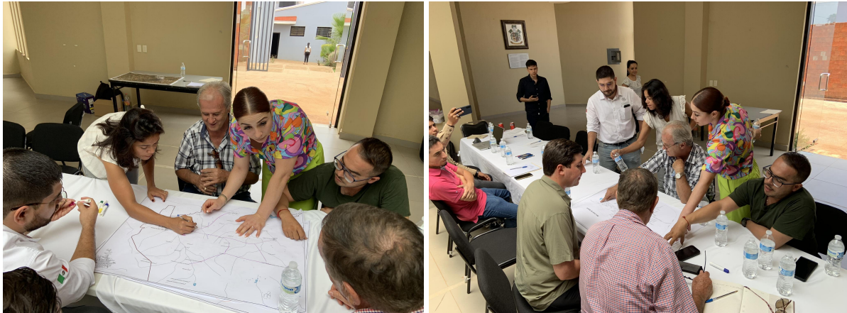
Figura 3. Cartografía social en San José de Gracia.

Respecto a la cartografía social, todos los problemas mencionados fueron mapeados en los planos durante los focus group, la información se digitalizó y fue agregada en su apartado correspondiente del diagnóstico.