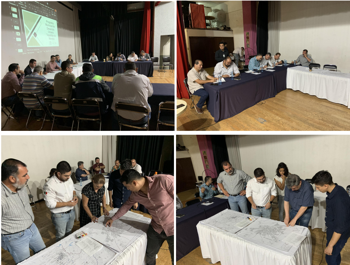
Figura 2. Cartografía social en Tepatlán de Morelos.