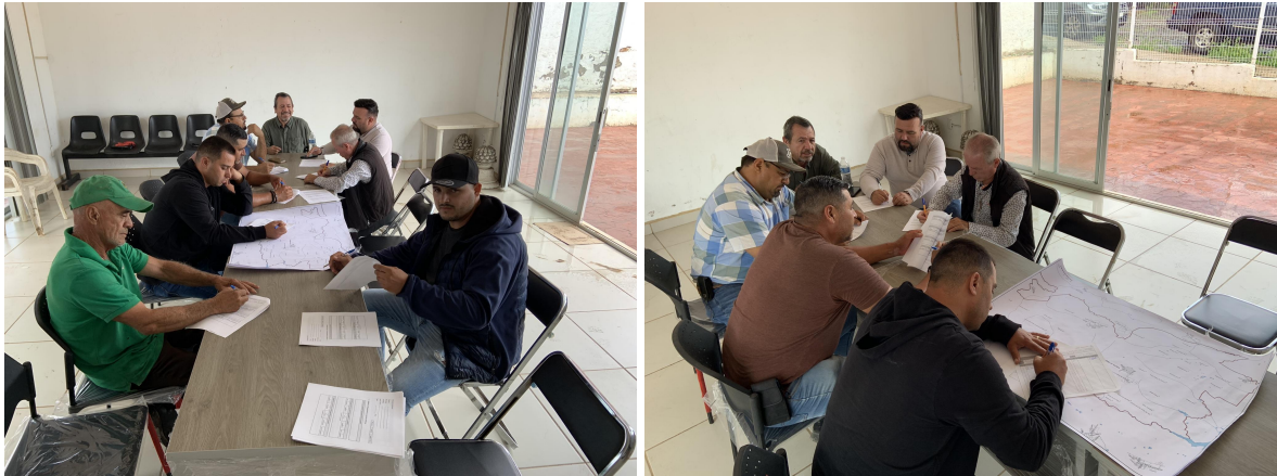
Figura 7. Cartografía social en Capilla de Milpillas.