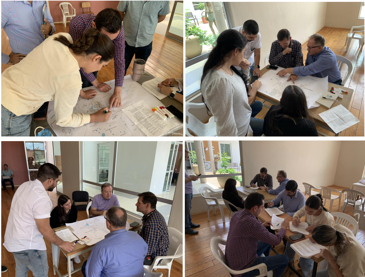
Figura 6. Cartografía social en Capilla de Guadalupe.