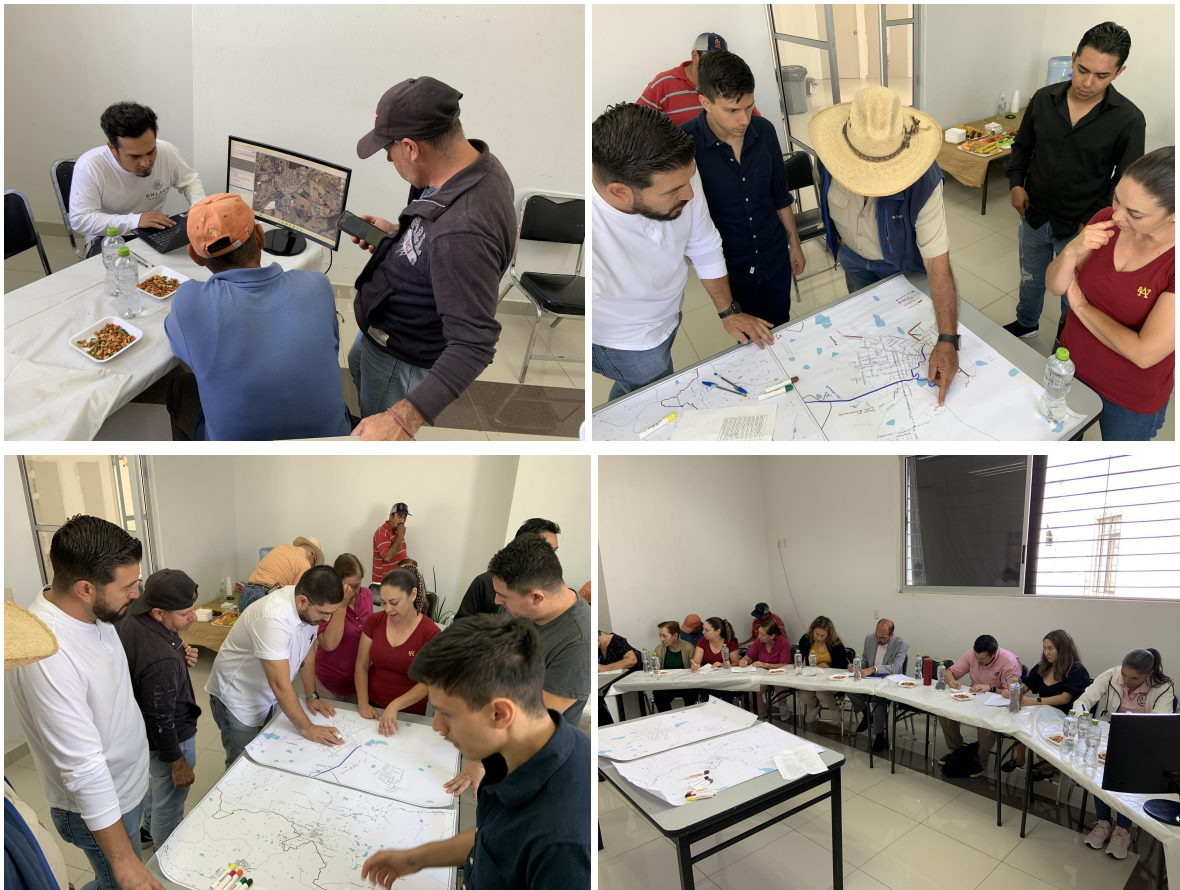
Figura 5. Cartografía social en Pegueros

Respecto a la cartografía social, todos los problemas mencionados fueron mapeados en los planos durante los focus group, la información se digitalizó y fue agregada en su apartado correspondiente del diagnóstico.